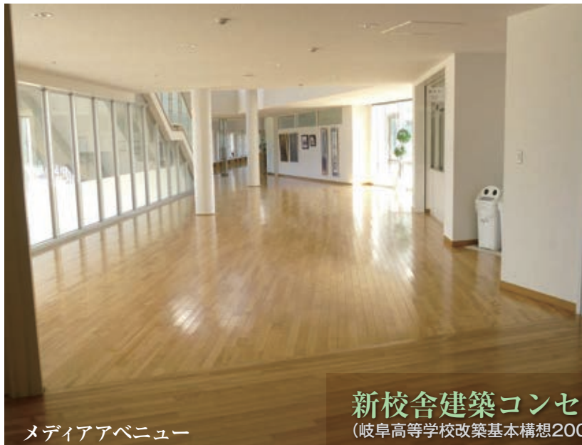
メディアアベニュー