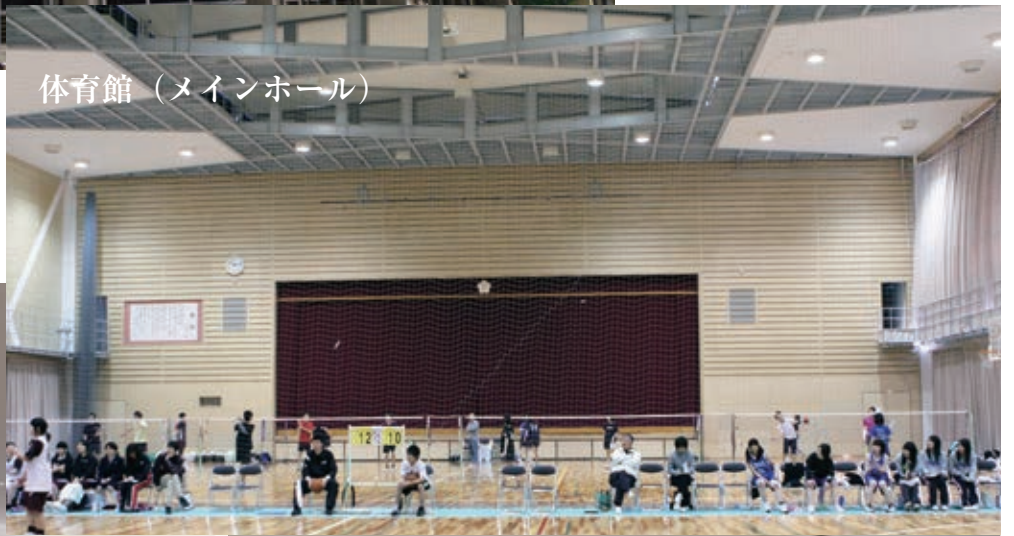
体育館（メインホール）