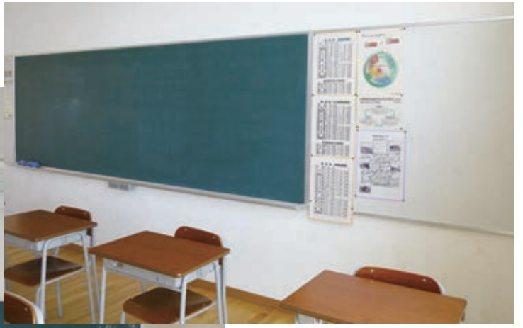
クラスルーム（教室）